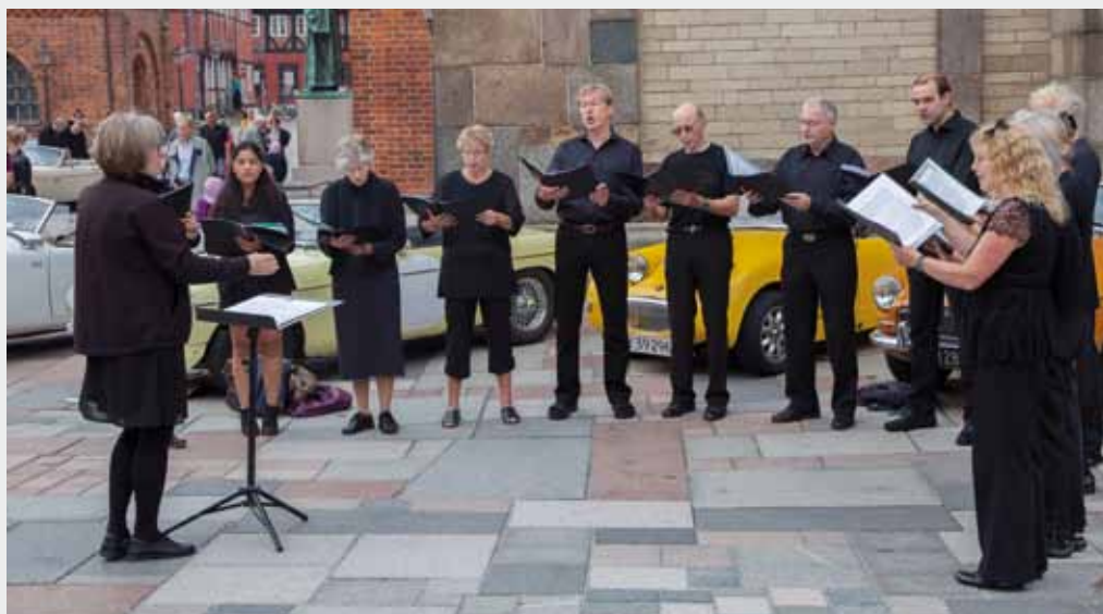
Rued Langgaard Festival 2014.