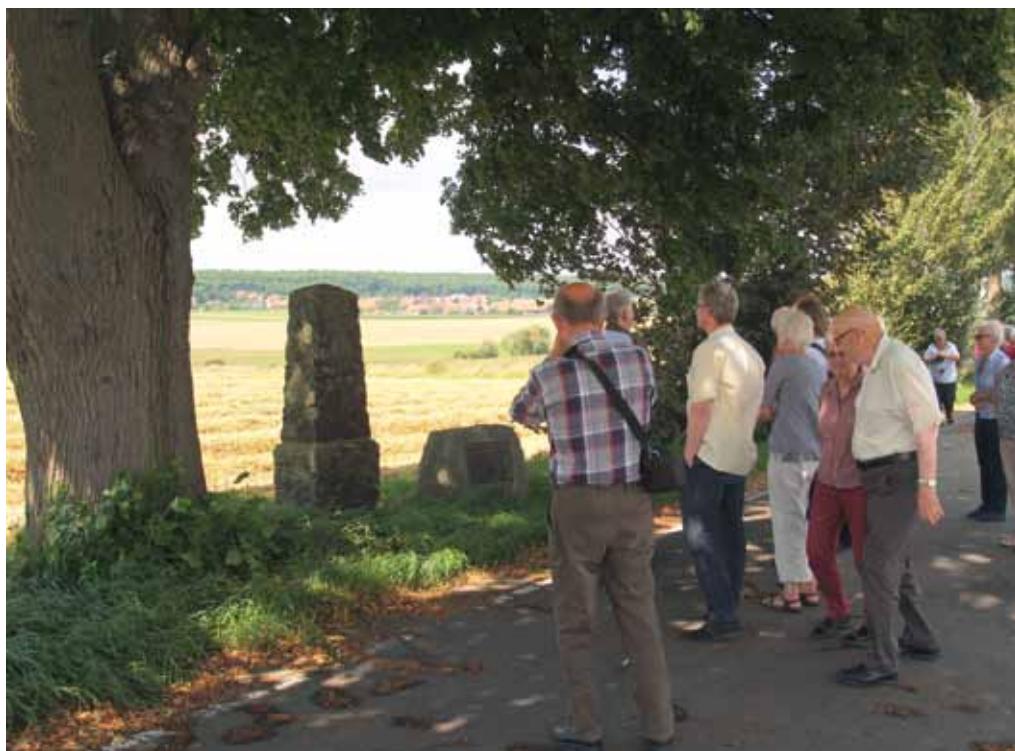
Slagmarken ved Lutter am Barenberge.

Første stop på turen til Harzen var landsbyen Lutter am Barenberge et halvt hundrede km nordvest for Drübeck. Her udkæmpede Christian IV den 27. august 1626 et stort slag i 30-årskrigen mod den tysk-romerske kejsers general, grev Tilly, og tabte. 30-årskrigen var et opgør mellem de sydtyske katolikker og de nordtyske protestanter. I deres kvide havde pro-