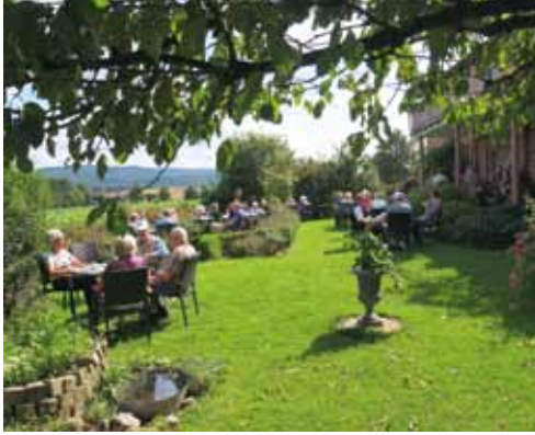
Kaffe ved Lutter am Barenberge.

testanterne henvendt sig til den danske konge om hjælp. Christian IVs nederlag, der vist ikke er særlig kendt i den almene danske befolkning, fik stor betydning for Danmarks fremtid. Nederlaget blev begyndelsen til enden for Danmark som stormagt med 1864 som det slutpunkt, der gjorde Danmark til den småstat, landet er i dag.