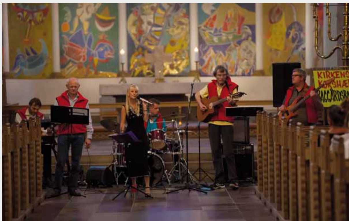
Det odenseanske »baggårdsband« ved en musikgudstjeneste i Domkirken 17. september 2014 med temaet diakoni.

Entré 120 kr. Billetter købes på billetten.dk eller ved indgangen ½ time før.