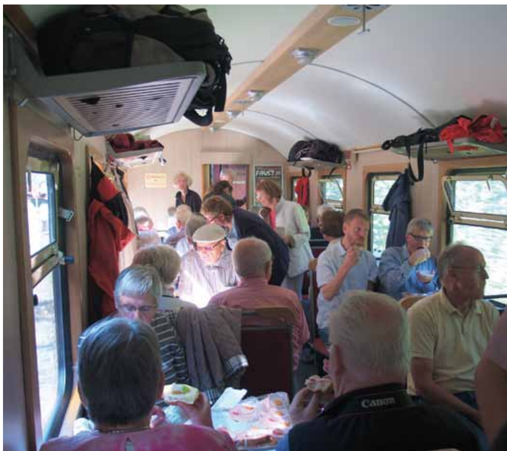
I spisevognen mod Brocken.

Efter 6 oplevelsesrige dage i herligt sommervejr var turen slut, og kun hjemrejsen ventede.