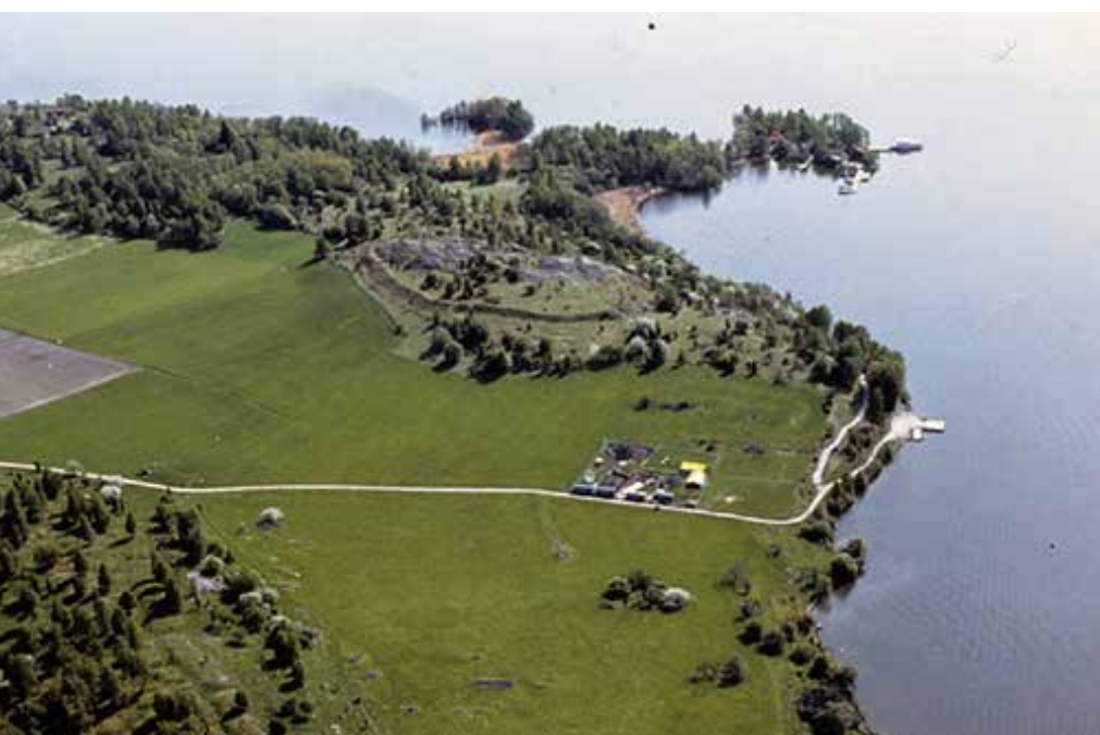
Fra venstre mod højre, nederst: Birka Gripsholm Slot Birgittasøster