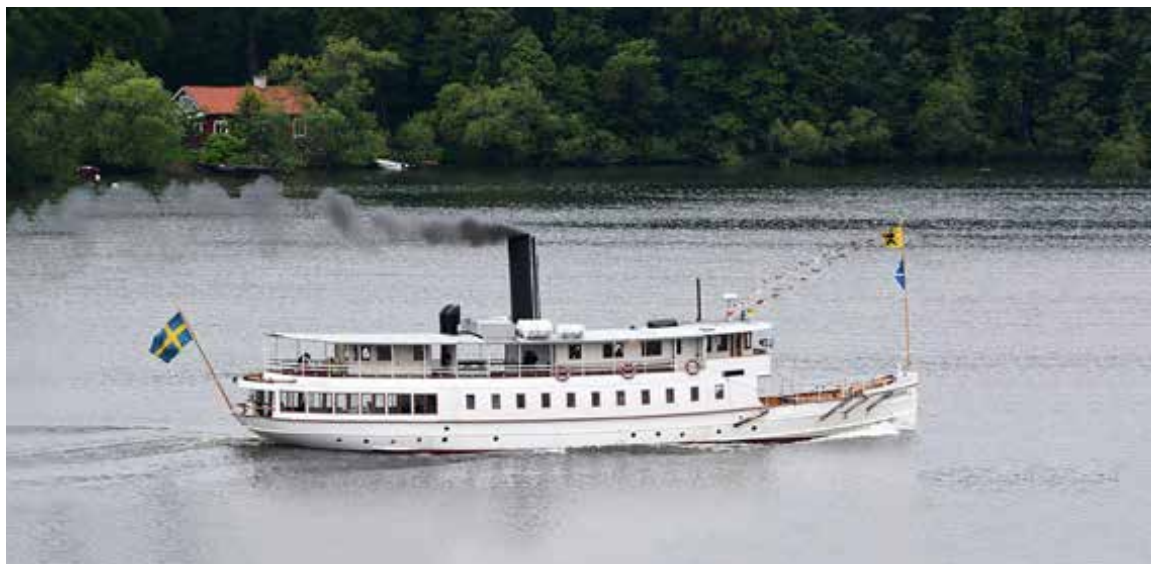
Fra venstre mod højre, øverst: Rönninge Gård Kungsgård S/S Mariefred